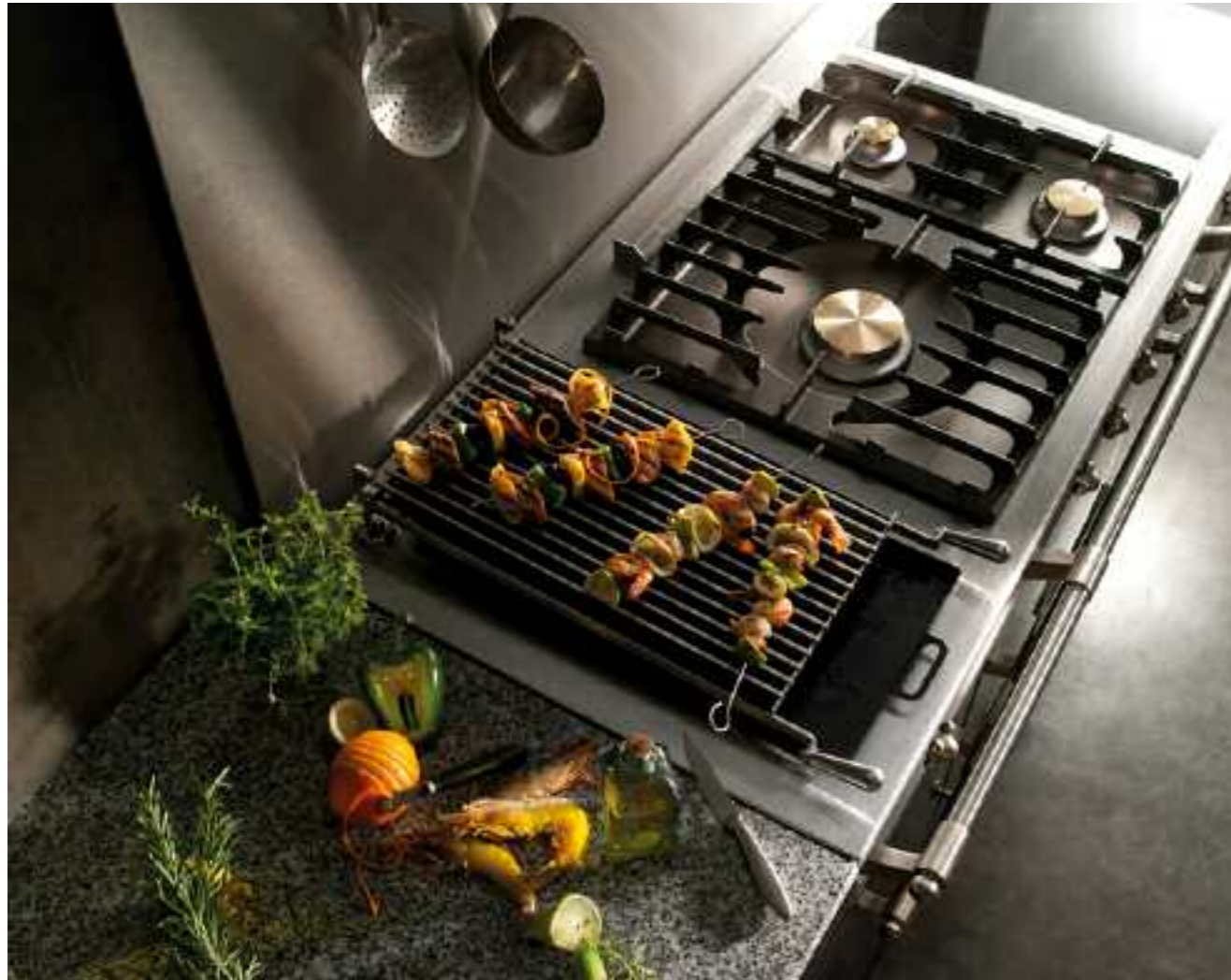
Chez Lacanche, la table Fontenay est imposante par ses dimensions généreuses. Les configurations proposées permettent de disposer d'un plan de cuisson complet et spacieux. Les armoires calorifugées (en option) peuvent recevoir la platerie du four et maintenir au chaud des préparations ou les assiettes avant le service. Le four, de grande capacité, est disponible en version gaz, électrique statique ou électrique à convection forcée.